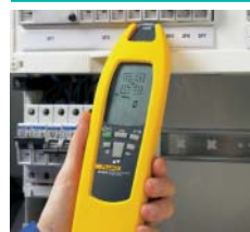
Auffinden von Sicherungen und Sicherungsautomaten und Zuordnung zu Stromkreisen