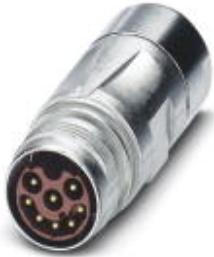
Kupplungssteckverbinder, gerade, SPEEDCON-Verriegelung, M17, Polzahl: 17, Kontaktart: Stift, Crimpanschluss, geschirmt: ja, Kabeldurchmesser: 9 mm...11 mm

Bitte beachten Sie, dass die hier angegebenen Daten dem Online-Katalog entnommen sind. Die vollständigen Informationen und Daten entnehmen Sie bitte der Anwenderdokumentation. Es gelten die Allgemeinen Nutzungsbedingungen für Internet-Downloads. ( http://download.phoenixcontact.de )