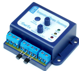
Abb. Modul im optionalen Gehäuse 19 12 92

Das Differenztemperatur-Steuermodul ist für den Einbau in das TowiTek Universal-Modulgehäuse geeignet, das unter Bestellnummer 19 12 92 erhältlich ist. Passend gedruckte und gestanzte Frontfolien liegen bei.