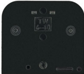
013010 TW für SAK 4

Um den unterschiedlichen Anforderungen an unsere Produkte gerecht zu werden, ist der Einsatz verschiedener, auf die Anwendung zugeschnittener Isolierstoffe erforderlich. Alle von Weidmüller eingesetzten Isolierstoffe sind frei von gefährlichen Schadstoffen. Vor allem wird auf cadmiumfreie Materialien Wert gelegt. Sie enthalten ferner keine Farbpigmente auf Schwermetallbasis und sind frei von Dioxin- oder Furanbildner.