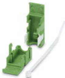
Kabelgehäuse, Rastermaß: 0 mm, Polzahl: 2, Maß a: 10 mm, Farbe: grün

Bitte beachten Sie, dass die hier angegebenen Daten dem Online-Katalog entnommen sind. Die vollständigen Informationen und Daten entnehmen Sie bitte der Anwenderdokumentation. Es gelten die Allgemeinen Nutzungsbedingungen für Internet-Downloads. ( http://download.phoenixcontact.de )