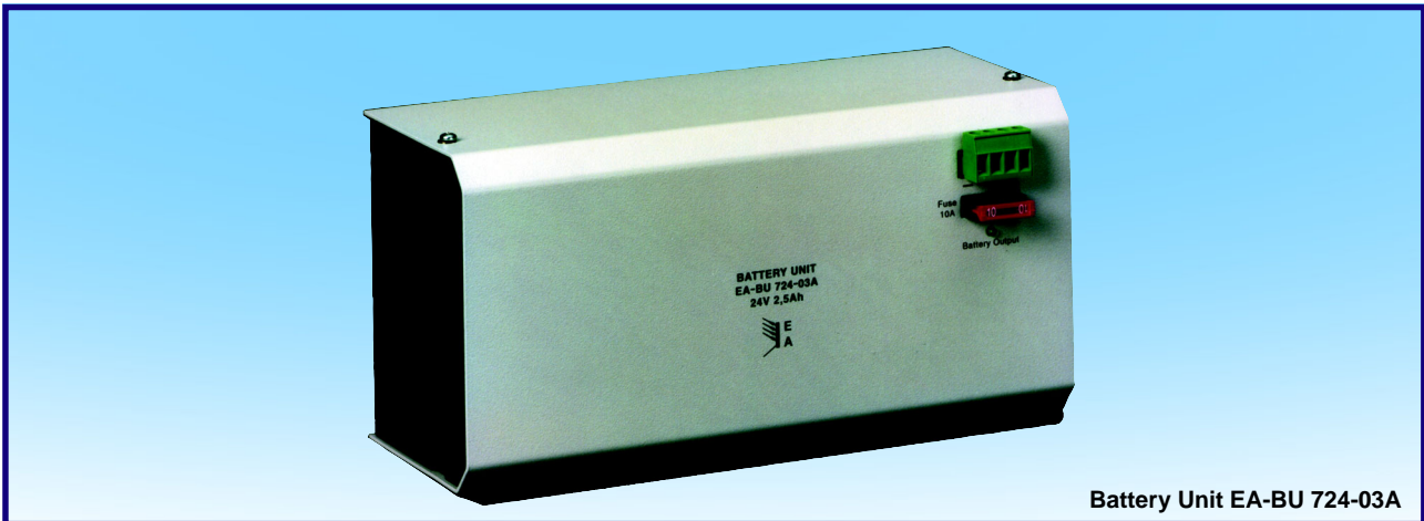
Battery Unit EA-BU 724-03A

Die Batterieeinheiten der Serien EA-BU 700 und EA-BU 800 sind für die DC-USV Serie EA-UPS 700 und EA-UPS 800 konzipiert und werden mit 12V, 24V oder 48V geliefert.