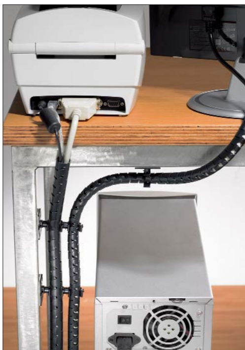
Komplett kabelskyddssystem som passar hem och kontorsmiljöer.

Helawrap används till att bunta och skydda kablar inom den elektriska industrin, skåpbyggnation, maskintillverkning och fordonsindustri. Helawrap i 25-meterslängder är en tidsbesparande lösning för industriella applikationer. Genom sitt excellenta flamskydd, är Helawrap Polyamid 6 V0 det rätta produktvalet där brandskydd är av stor vikt, t ex i kollektivtrafik.