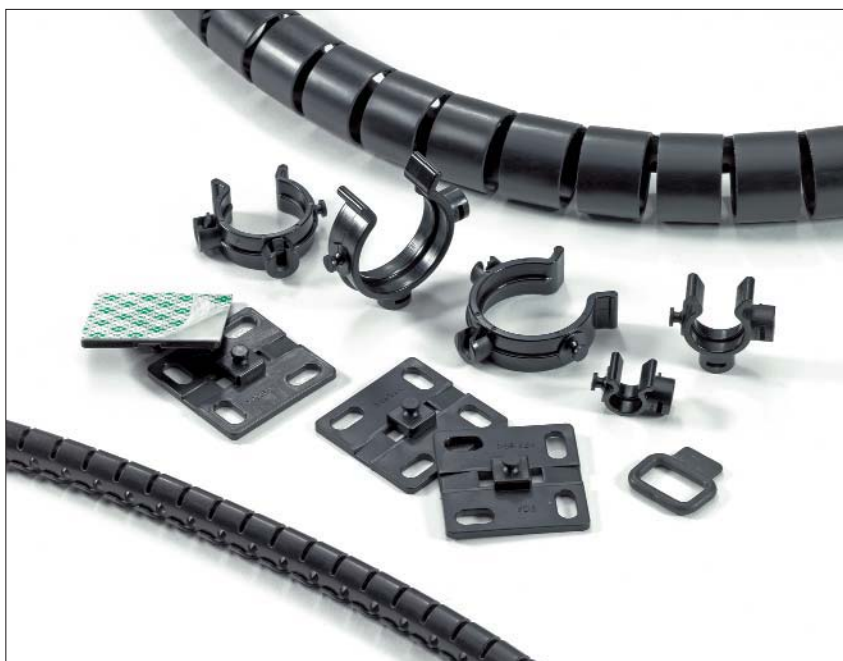
Helawrap tillbehörset för buntning, fixering och skydd av många olika typer av kabeldragning.

Helawrap hållare och fästplattor kan länka ihop en kedja av kabelbuntar i samband med att du skyddar och fixerar kablar på industriella maskiner. De kan också användas i apparatskåp, speciellt vid luckan där rörelse utförs. Tillbehören till Helawrap används också för att fixera kabelbuntar i hem och kontor.