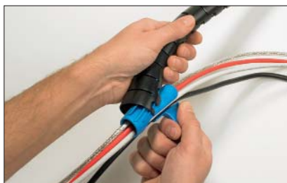
Placera appliceringsverktyget i en av ändarna på Helawrap.