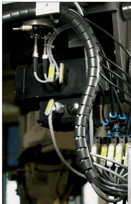
Bättre och effektivare kabelskydd genom förgreningsmöjlighet var som helst utefter skyddet.