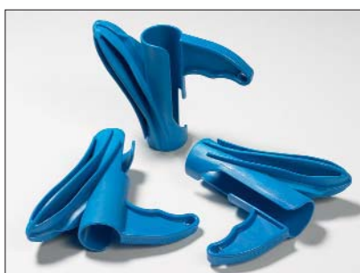
Applikeringsverktyget HAT finns för varje storlek av Helawrap.

Helawrap applikeringsverktyg möjliggör för användaren att snabbt och enkelt installera ledningar, kablar och slangar. Verktöget har optimerats så att det enkelt och säkert glider genom skyddet och tillåter därmed införing av kablarna i Helawrap. Designen tillåter också individuella kabeländar att plockas ut från applikatorn och förgrenas genom skyddets hål. Ett applikeringsverktyg medföljer alltid i Helawrap-paketet. Extra verktyg kan köpas separat.