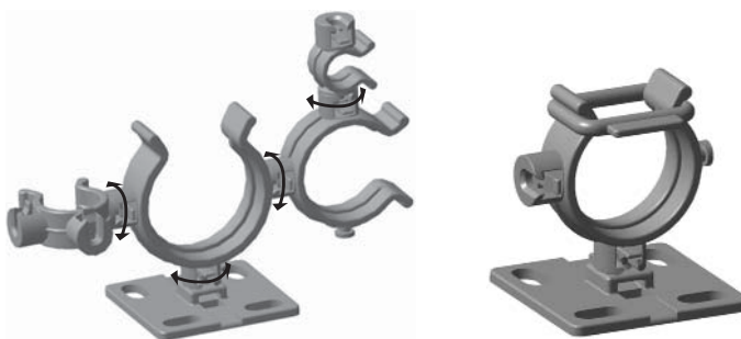
Flera hållare kan sättas ihop. Hållarna snurrar fritt.