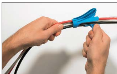
Lägg in en eller fler kablar i appliceringsverktyget.

Helawrap i praktiska 2 meterslängder är designad för användning i hemmet eller på kontoret. Äntligen kan man få slut på kabelkaoset runt PC:n, TV:n och stereon.