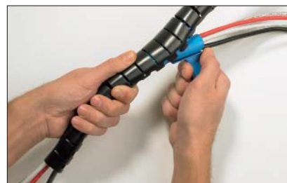
För Helawrap över ditt kablage genom att dra appliceringsverktyget genom kabelskyddet.