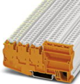
Einspeiseklemme, Anschlussart: Zugfederanschluss, Querschnitt: 0,08 mm 2 - 4 mm 2 , AWG: 28 - 12, Breite: 10,4 mm, Farbe: orange, Montageart: NS 35/7,5, NS 35/15

Bitte beachten Sie, dass die hier angegebenen Daten dem Online-Katalog entnommen sind. Die vollständigen Informationen und Daten entnehmen Sie bitte der Anwenderdokumentation. Es gelten die Allgemeinen Nutzungsbedingungen für Internet-Downloads. ( http://download.phoenixcontact.de )