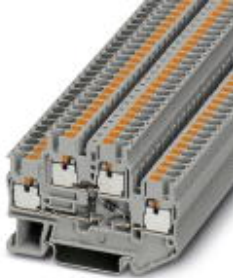
Durchgangsklemme, Querschnitt: 0,14 mm 2 - 4 mm 2 , AWG: 26 - 12, Anschlussart: Push-in-Anschluss, Breite: 5,2 mm, Farbe: grau, Montageart: NS 35/7,5, NS 35/15

Bitte beachten Sie, dass die hier angegebenen Daten dem Online-Katalog entnommen sind. Die vollständigen Informationen und Daten entnehmen Sie bitte der Anwenderdokumentation. Es gelten die Allgemeinen Nutzungsbedingungen für Internet-Downloads. ( http://download.phoenixcontact.de )