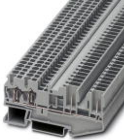
Durchgangsklemme, Anschlussart: Zugfeder- / Steckanschluss, Querschnitt: 0,08 mm 2 - 4 mm 2 , AWG: 28 - 12, Breite: 5,2 mm, Farbe: blau, Montageart: NS 35/7,5, NS 35/15

Bitte beachten Sie, dass die hier angegebenen Daten dem Online-Katalog entnommen sind. Die vollständigen Informationen und Daten entnehmen Sie bitte der Anwenderdokumentation. Es gelten die Allgemeinen Nutzungsbedingungen für Internet-Downloads. ( http://download.phoenixcontact.de )