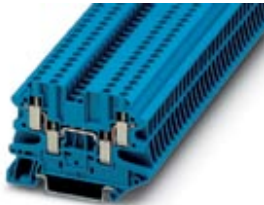
Durchgangsklemme, Anschlussart: Schraubanschluss, Querschnitt: 0,14 mm 2 - 4 mm 2 , AWG: 26 - 12, Breite: 5,2 mm, Farbe: blau, Montageart: NS 35/7,5, NS 35/15

Bitte beachten Sie, dass die hier angegebenen Daten dem Online-Katalog entnommen sind. Die vollständigen Informationen und Daten entnehmen Sie bitte der Anwenderdokumentation. Es gelten die Allgemeinen Nutzungsbedingungen für Internet-Downloads. ( http://download.phoenixcontact.de )