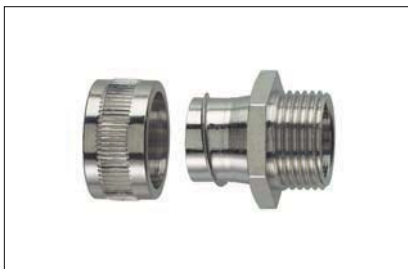
HelaGuard SC-FM Raccord Fixe, Pas Externe.