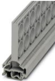
Leergehäuse, zur Montage auf NS 32 oder NS 35/7,5, doppelstöckig

Bitte beachten Sie, dass die hier angegebenen Daten dem Online-Katalog entnommen sind. Die vollständigen Informationen und Daten entnehmen Sie bitte der Anwenderdokumentation. Es gelten die Allgemeinen Nutzungsbedingungen für Internet-Downloads. ( http://download.phoenixcontact.de )