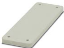
HEAVYCON Abdeckplatte, für Wandausschnitte der Bauform B16, Dicke 7 mm, grau

Bitte beachten Sie, dass die hier angegebenen Daten dem Online-Katalog entnommen sind. Die vollständigen Informationen und Daten entnehmen Sie bitte der Anwenderdokumentation. Es gelten die Allgemeinen Nutzungsbedingungen für Internet-Downloads. ( http://download.phoenixcontact.de )