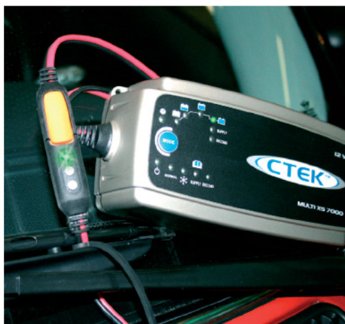
... čez noč ena skrb manj